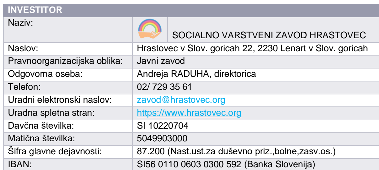
Tabela 1: Osnovni podatki o javnem partnerju

Socialno varstveni zavod Hrastovec (krajše: SVZ Hrastovec) je bil osnovan že leta 1948 in je javni zavod, katerega ustanoviteljica je Republika Slovenija. Skrbi za institucionalno varstvo odraslih, ki imajo težave v duševnem zdravju in težave v duševnem razvoju. Deluje na 12 lokacijah, poleg Hrastovca v Slovenskih goricah še v Hodošu, Rožengruntu, Trnovski vasi, Zgornji Ščavnici, Radencih, Zrkovcih, Gornji Radgoni, Sp. Voličini, Mariboru in na dveh lokacijah v Apačah.